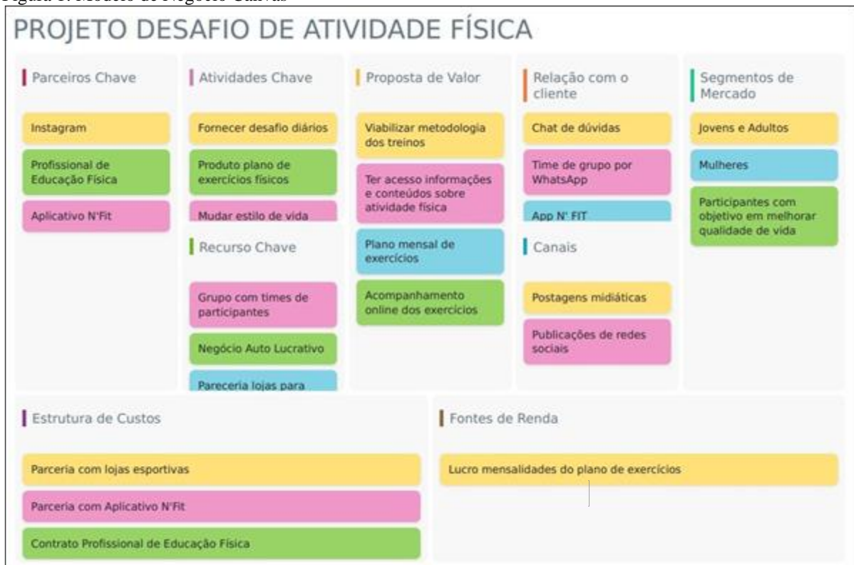
Figura 1: Modelo de Negócio Canvas

Fonte: Elaborado pela autora na plataforma Sebrae Canvas.