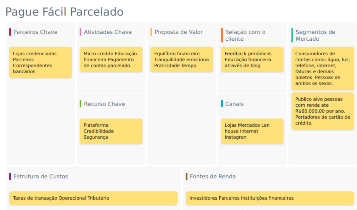
Figura 1: Modelo de Negócio Canvas