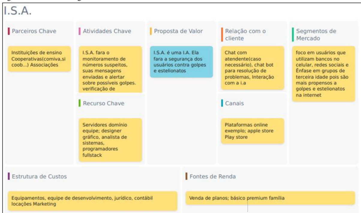
Figura 1: Modelo de Negócio Canvas