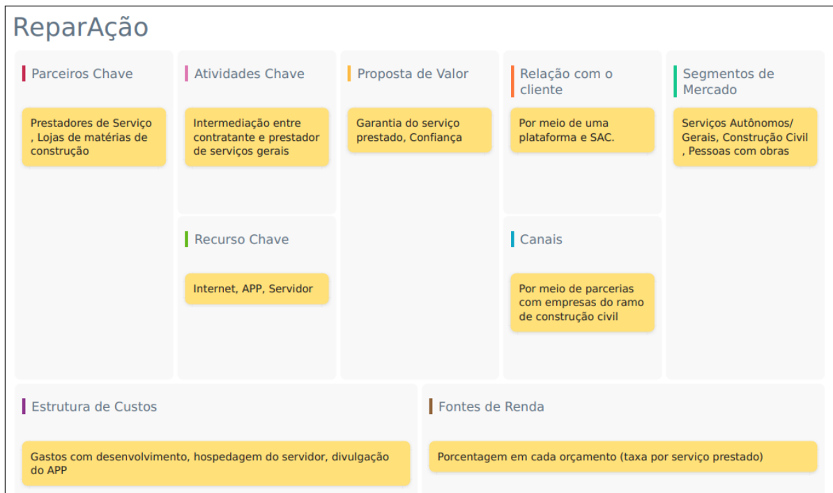
Figura 1: Modelo de Negócio Canvas