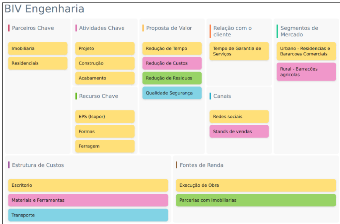
Figura 1: Modelo de Negócio Canvas