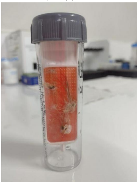
Figura 1: Amostra de pelos de um gato com suspeita clínica de dermatofitose, em cultura fúngica realizada em meio DTM