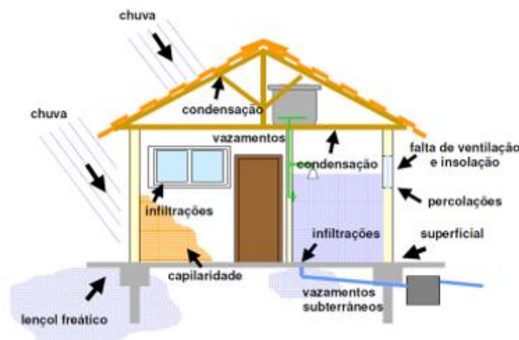
Figura 3 – Origens das Umidades nas edificações

Quando falamos das manifestações patológicas ocasionadas pela falta ou má execução do processo de impermeabilização, inicialmente temos que identificar onde está a origem da umidade. Como podemos ver na imagem a seguir, existem diversos fatores que podem causar umidade na edificação. (HUSSEIN, 2013)